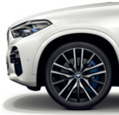
22인치 더블 스포크 742 M 휠