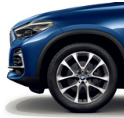
20인치 V 스포크 738 휠

M 스포츠 배기 시스템 은 Sport 혹은 Sport+ 모드를 선택하면 강렬하고 역동적인 엔진 사운드를 배출하여 운전자의 가슴을 설레게 합니다. 반면, Comfort 모드에서는 잔잔하고 감성적인 엔진 사운드를 배출합니다. *M Sport Package와 M50i에 한해 적용.